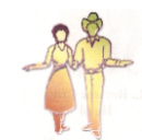
R. Open Promenade