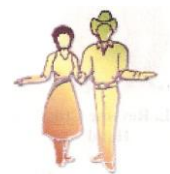
R. Open Promenade

Traduction Robert Martineau, ajouté sur le site le 10 février 2011