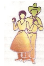
R. Side by Side Sweetheart

Traduction Robert Martineau, ajouté sur le site le 06 décembre 2009